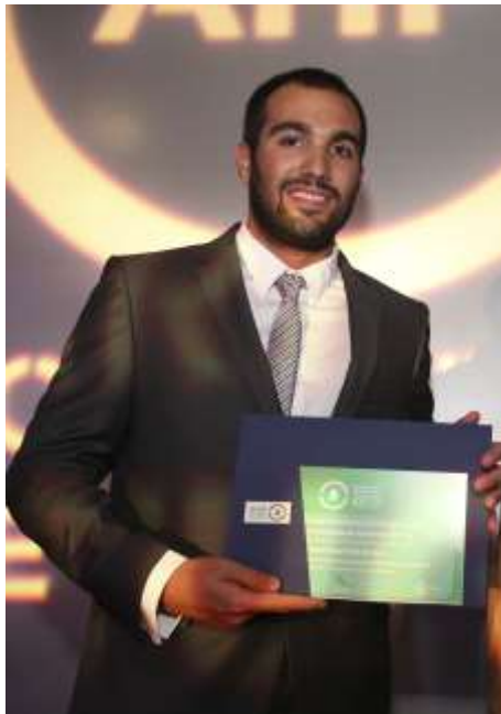
27º Congresso da AHP

A AHP já entregou 83 selos desde o lançamento do projeto, reconhecendo, assim o compromisso social e ambiental dos seus associados.